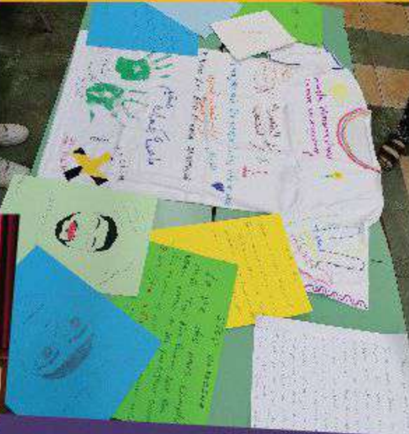
George Floyd. Καλλιτεχνική διαμαρτυρία των μαθητών για τον ρατσισμό.

Φεβρουάριος 2020. Μαθητικός διαγωνισμός «Όσα δεν μπαίνουν στη βαλίτσα σε συνεργασία με τη ΣΤ3 στην Ζηπαρίου». Τα παιδιά, παίρνοντας στο χέρι τις φανταστικές τους βαλίτσες, ξεκινούν έναν διάλογο ενώναοντας διαφορετικά υλικά και φτιάχνοντας χρωματιστά κολάζ. Είδαμε τις ιδέες και τα όνειρα των παιδιών να ταυίζονται και μας ταξίδεψαν σε κόσμους μακρινούς